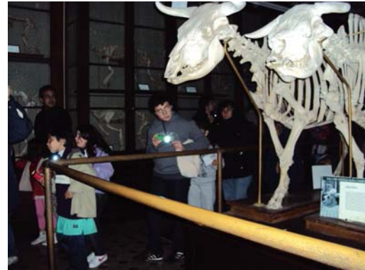
Noche de los museos 2011