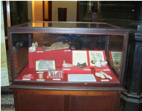
Muestra Florentino Ameghino