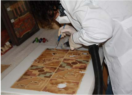
Conservación de textiles en depósito 25