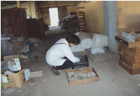
Preparación mudanza colecciones en Florencio Varela