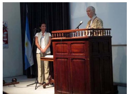
Conferencia Jane Goodall