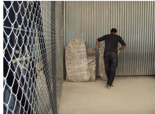
Ubicación en depósito 64 y 120 de colecciones mudadas de Florencio Varela