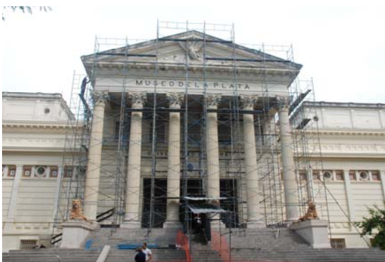
Fachada edificio en restauración