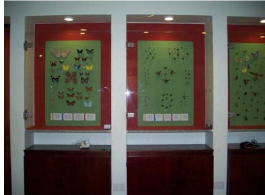
Muestra temporaria sobre Insectos