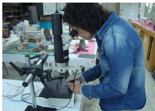
Capacitación en Museo Antropol.. México