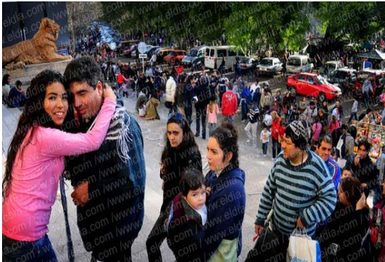
Vacaciones de Invierno 2011