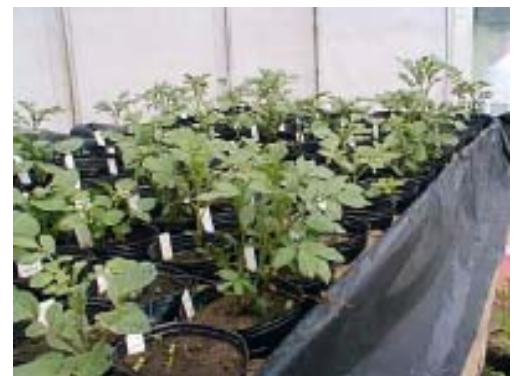
Figura 4. Germoplasma de papa. El banco está ubicado a 15 km de la ciudad de Balcarce sobre la ruta 226 en el km 73,5 en la Estación Experimental Agropecuaria Balcarce del INTA.