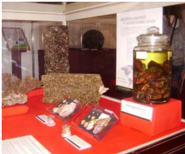
Figura 2: Muestra itinerante sobre bioinvasiones. Exposición en el Centro Cultural Pasaje Dardo Rocha, La Plata, 2011 (Foto: G. Darrigran).

(Recuadro 1), permite el análisis de especímenes recolectados en diferentes momentos y en diferentes puntos, lo que les permite a los investigadores reconstruir cambios temporales; las personas no pueden viajar en el tiempo, pero las colecciones biológicas les ofrecen a los científicos una ventana al pasado.