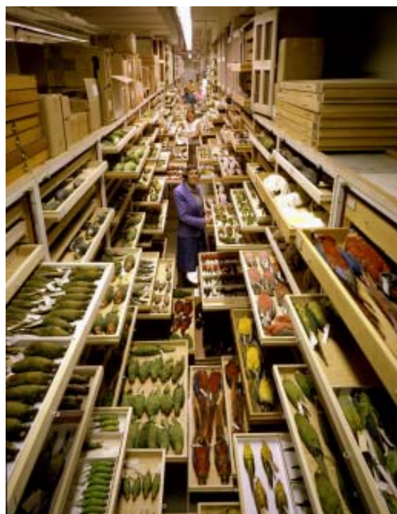
Figura 1. Colección de aves del Smithsonian's National Museum of Natural History.