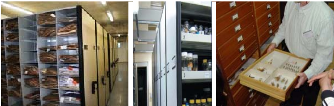
Figura 5: a: Herbario de Instituto Darwinion, b: colección de invertebrados y c: colección entomológica del Museo de La Plata.

3. Fuentes de ejemplares para la seguridad alimentarla, la conservación y la investigación biológica: algunas colecciones biológicas , incluyen organismos vivos. Estas colecciones comprenden cultivos, bancos de semillas y repositorios de germoplasma de plantas (Figura 4), centros de material genéticos, zoológicos, programas de cría en cautividad y otros centros de recursos biológicos. Estos lotes con características genéticas y fisiológicas conocidas, son recursos biológicos importantes para la investigación, la agricultura, el control de especies parásitas u otras enfermedades y la protección, recuperación y reintroducción de especies en peligro de extinción. Fuentes de alimento, cultivos y animales de granja pueden ser diezmadados por enfermedades, cambios climáticos u otros desastres. Con estas colecciones se provee la copia de seguridad de última instancia para reintroducir estas fuentes de alimentos esenciales.